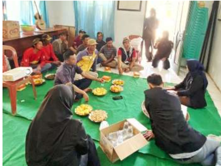
Gambar 2. Kegiatan diskusi mengenai cara budi daya BSF

Pada Gambar 2 merupakan tampilan antusiasme petani dalam mempelajari pemanfaatan BSF sebagai agen pengolahan limbah pertanian secara berkelanjutan terlihat pada hasil post-test yang dilakukan setelah penyampaian materi dan kegiatan diskusi selesai. Hal tersebut dapat dilihat pada grafik yang disajikan (Gambar 3). Hasil post-test menunjukkan adanya peningkatan pengetahuan petani mengenai pemanfaatan BSF dan ketertarikan dalam praktik pemanfaatannya. Seluruh petani responden memberikan jawaban “Ya” pada kelima pertanyaan yang diajukan dalam kuesioner, mulai dari pengetahuan dasar tentang BSF, pemanfaatannya, hingga ketertarikan untuk mengimplementasikannya.